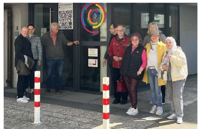
Unsere Gruppe vor dem Eingang