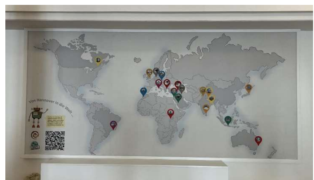
Weltkarte der heiligen Stätten der Religionen